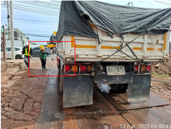
รูปที่ 2-11 เจ้าหน้าที่ทำความสะอาดล้อรถบรรทุก