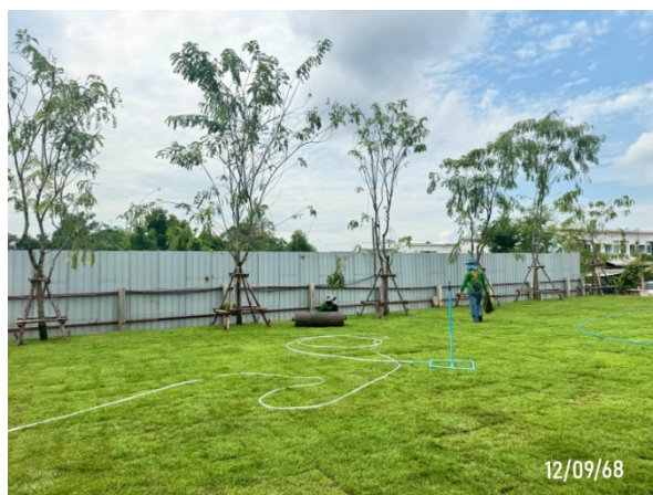
รูปที่ 2-1 สถานะโครงการ ช่วงเดือนกรกฎาคม – ธันวาคม 2568