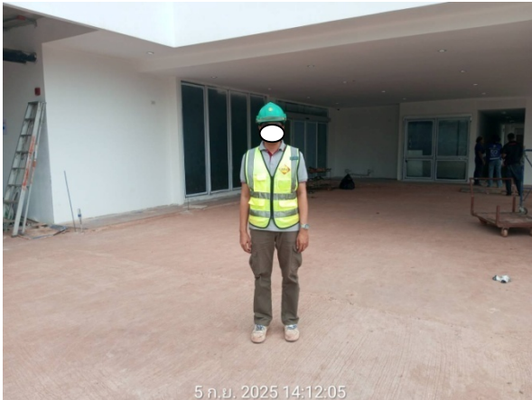
รูปที่ 2-20 ตัวอย่างการสวมใส่อุปกรณ์ คุ้มครองอันตรายส่วนบุคคล