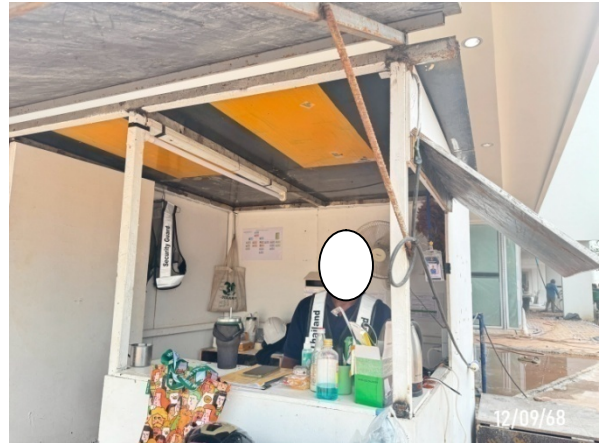
รูปที่ 2-7 เจ้าหน้าที่รักษาความปลอดภัย และอำนวยความสะดวกด้านการจราจร