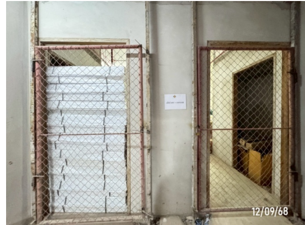
รูปที่ 2-15 STORE จัดเก็บอุปกรณ์และวัสดุก่อสร้าง