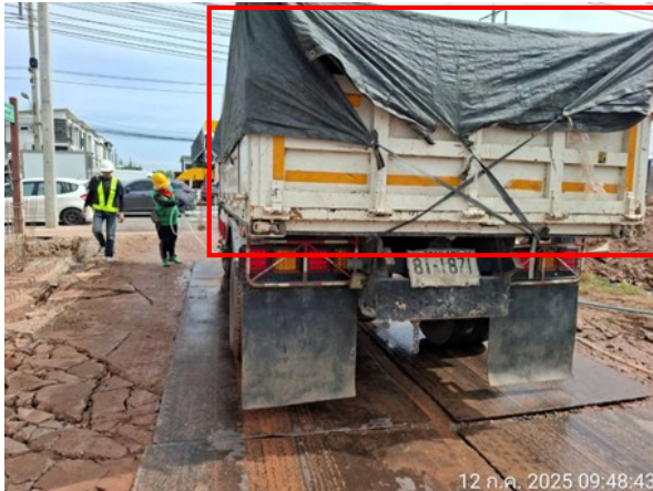
รูปที่ 2-6 การปิดคลุมท้ายรถบรรทุก