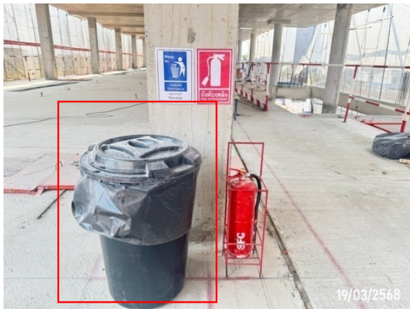
ภาชนะรองรับมูลฝอย