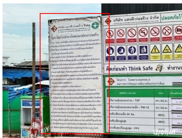
รูปที่ 2-14 ภาวะเบียบข้อบังคับภายในโครงการ