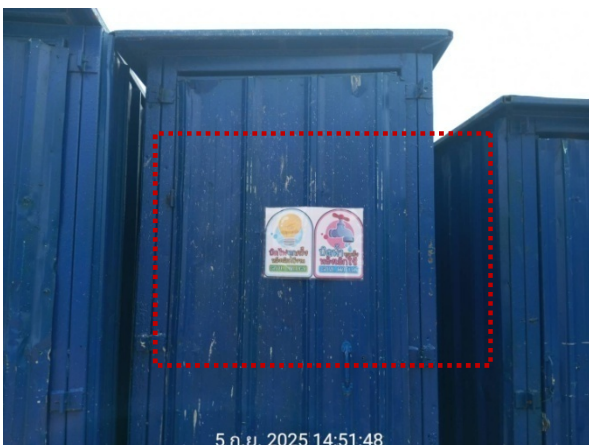
รูปที่ 2-23 ป้ายรณรงค์การประหยัดน้ำและประหยัดไฟ