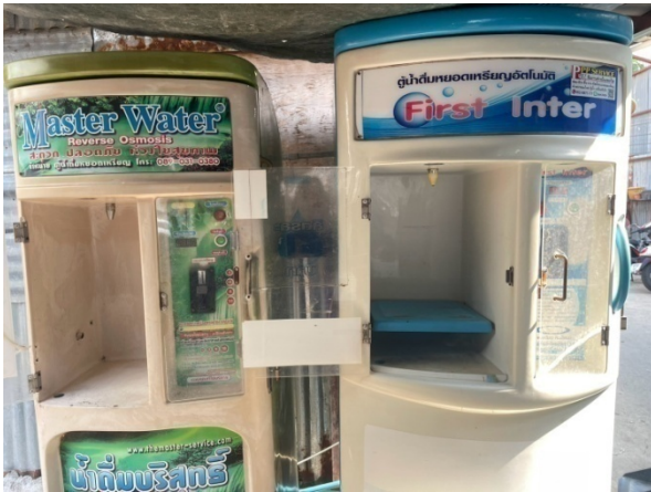
จุดบริการน้ำดื่ม