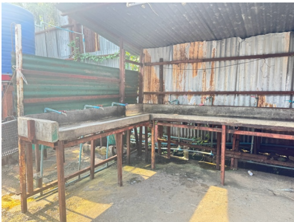
ลานอาบ/ซักล้าง