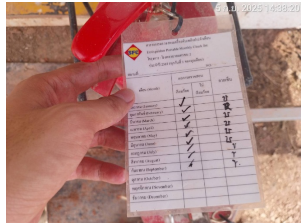
รูปที่ 2-29 เจ้าหน้าที่ตรวจสอบถังดับเพลิง