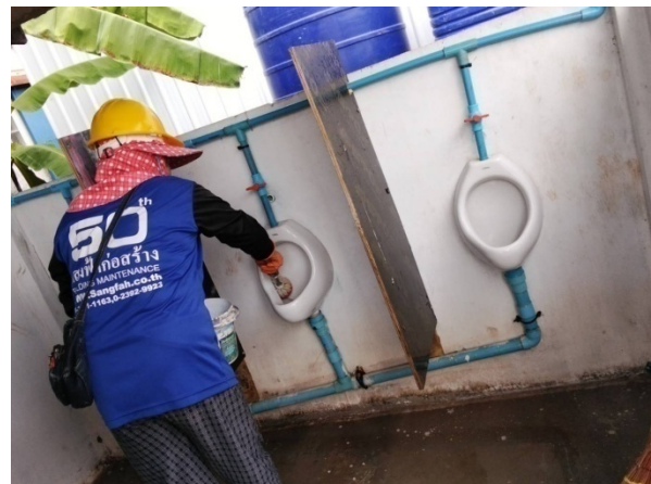
รูปที่ 2-22 เจ้าหน้าที่ทำความสะอาดห้องน้ำ/ห้องส้วม