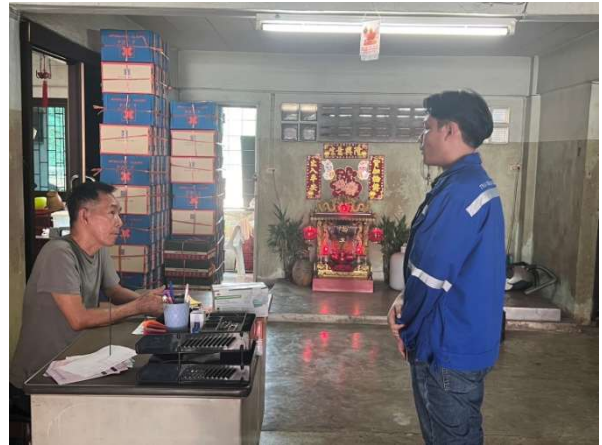
รูปที่ 2-2 เจ้าหน้าที่โครงการพบปะอาคารข้างเคียงช่วงก่อสร้าง