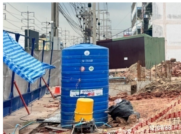
รูปที่ 2-24 ถังสำรองน้ำใช้