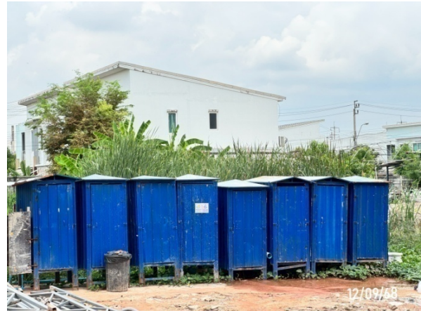
รูปที่ 2-21 ห้องน้ำ/ห้องส้วมชั่วคราว บริเวณพื้นที่โครงการ