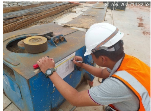
รูปที่ 2-13 ตัวอย่างเจ้าหน้าที่ตรวจสอบเครื่องมือและอุปกรณ์