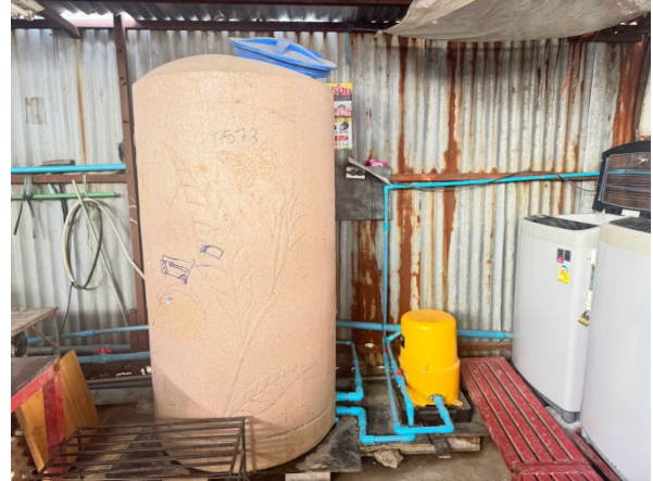
ถังสำรองน้ำใช้