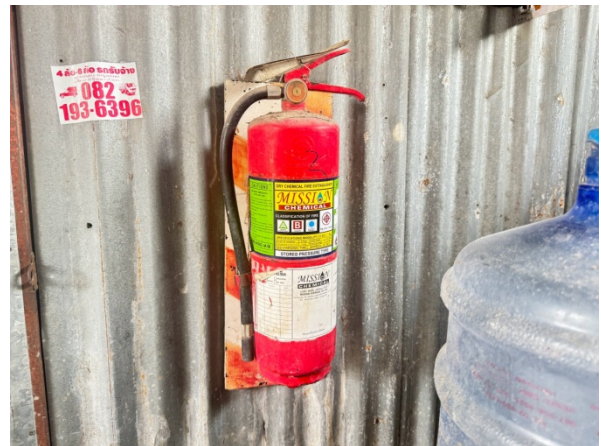
ถังดับเพลิง