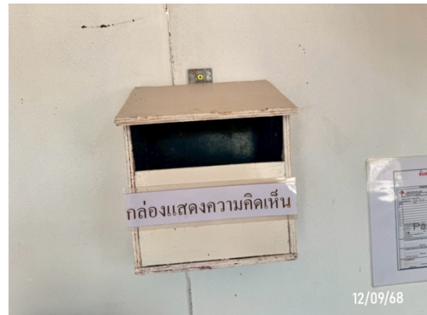
รูปที่ 2-9 กล่องรับความคิดเห็น