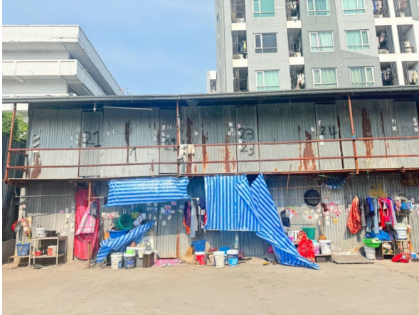
ห้องพักสำหรับคนงาน