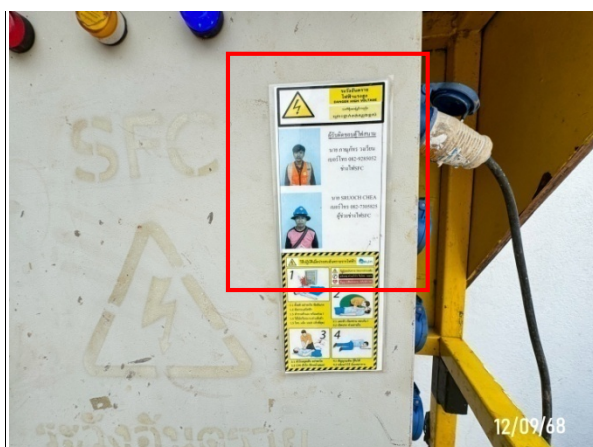
รูปที่ 2-27 ช่างเทคนิคไฟฟ้าประจำโครงการ