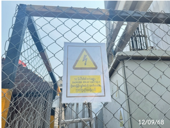
รูปที่ 2-34 ป้ายเตือนระวังอันตรายจากไฟฟ้าแรงสูง