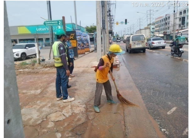
รูปที่ 2-12 เจ้าหน้าที่กวาดเศษดิน ทราย บริเวณพื้นที่ก่อสร้างโครงการ