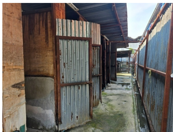
รูปที่ 2-32 ห้องน้ำ/ห้องส้วมชั่วคราว บริเวณบ้านพักคนงาน