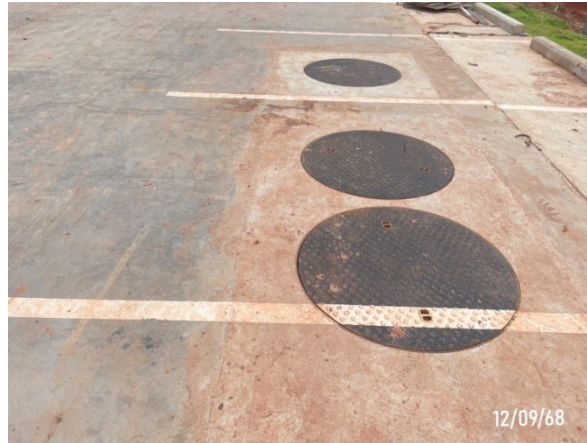
รูปที่ 2-25 ระบบบำบัดน้ำเสียถาวร