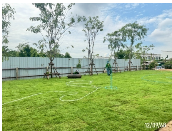
รูปที่ 2-10 เจ้าหน้าที่ดูแลบริเวณพื้นที่สีเขียว