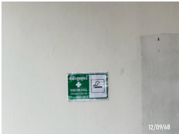
รูปที่ 2-36 พื้นที่สำหรับสูบบุหรี่