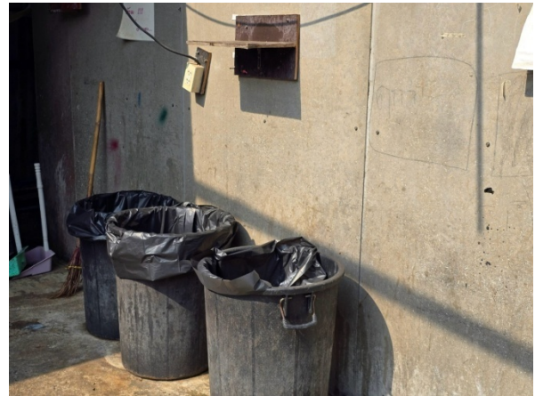
ภาชนะรองรับขยะมูลฝอย