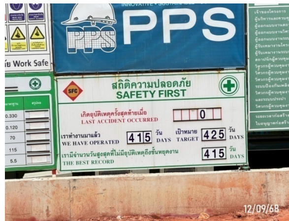
รูปที่ 2-40 ป้ายสถิติความปลอดภัย