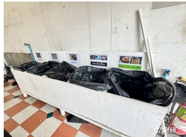
จุดคัดแยกขยะ