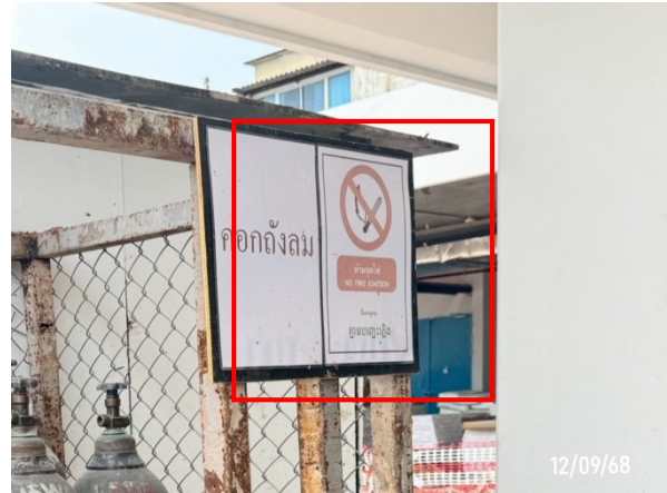
รูปที่ 2-35 ป้ายเตือน “ห้ามสูบบุหรี่”