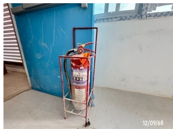
รูปที่ 2-28 ถังดับเพลิงเคมี