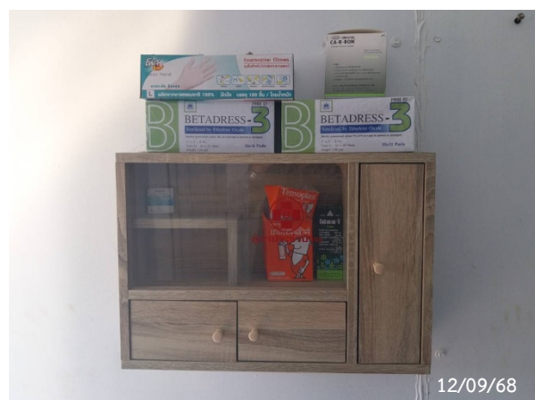
รูปที่ 2-39 อุปกรณ์ปฐมพยาบาลเบื้องต้น